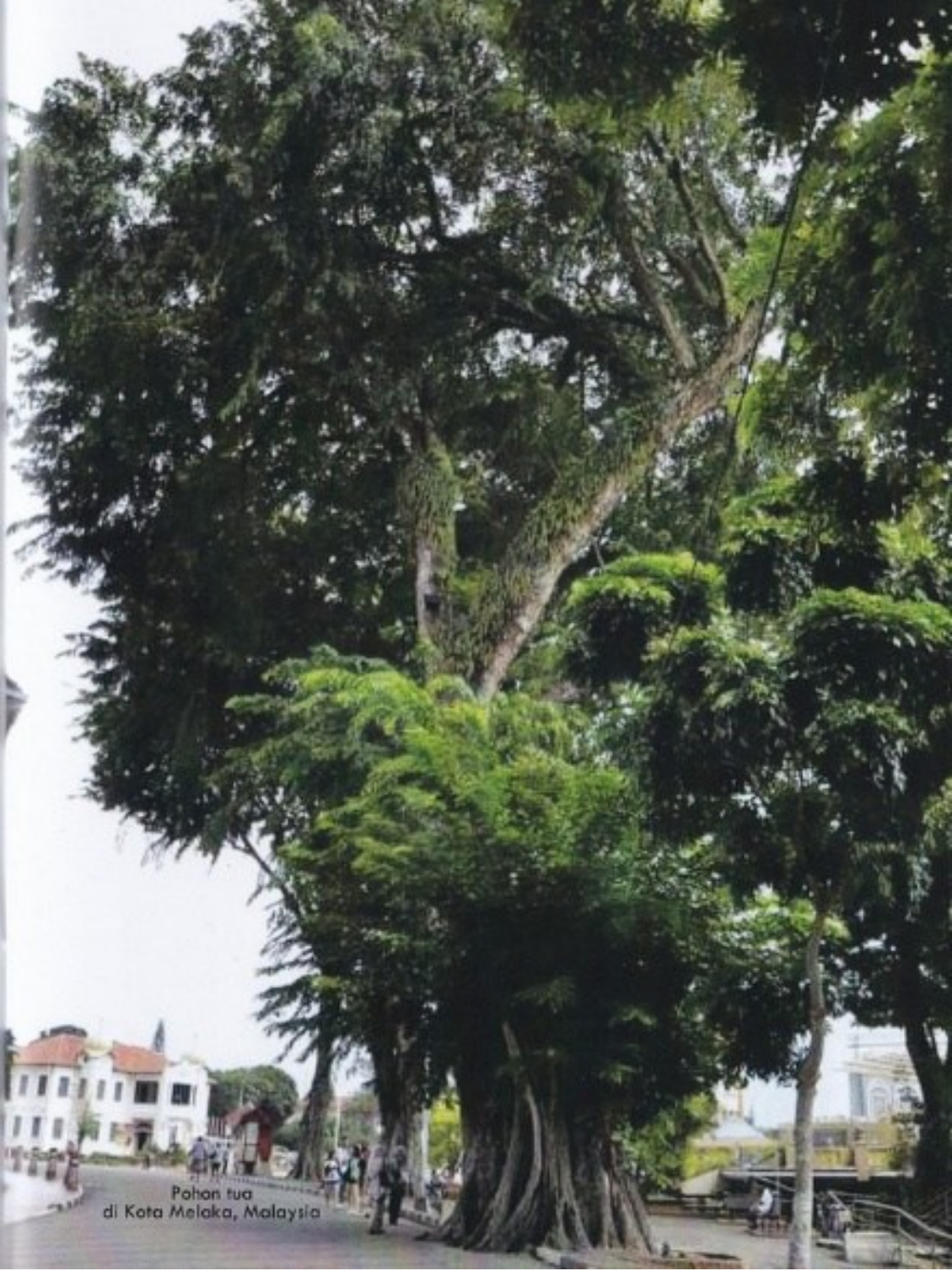
Pohon tua di Kota Melaka, Malaysia