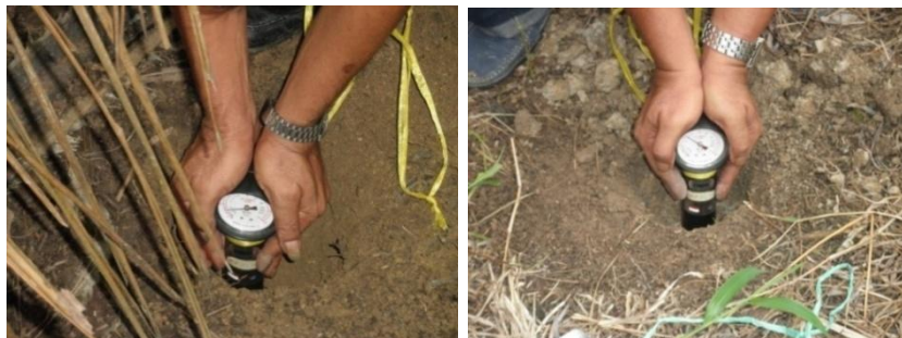
Gambar 3. Contoh pengukuran tahanan penetrasi tanah (13 Juni 2011)

Nilai tahanan penetrasi tanah, yang mencirikan perkiraan besar nilai kemampuan tanah menyangga beban di atasnya ( bearing capacity ), di areal lahan penelitian adalah sebesar 0.67 – 3.90 kgf/cm 2 (kondisi kering). Kondisi sifat mekanik tanah ini ideal untuk aplikasi mesin-mesin, seperti: bulldozer dan excavator , karena besar penekanan mesin terhadap tanah ( ground pressure ) umumnya sebesar 0.26 – 2.64 kgf/cm 2 . Dengan demikian, di lokasi tersebut dapat diaplikasikan mekanisasi pertanian, terutama pada saat dilakukan kegiatan pembukaan dan pembentukan lahan ( land clearing and land forming ). Dalam Gambar 3 ditunjukkan contoh pengukuran tahanan penetrasi tanah menggunakan hand penetrometer.