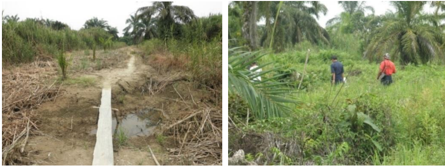
Gambar 2. Contoh kondisi awal areal lahan penelitian (13 Juni 2011)

Nilai tahanan penetrasi tanah, yang mencirikan perkiraan besar nilai kemampuan tanah menyangga beban di atasnya ( bearing capacity ), di areal lahan penelitian adalah sebesar 0.67 – 3.90 kgf/cm 2 (kondisi kering). Kondisi sifat mekanik tanah ini ideal untuk aplikasi mesin-mesin, seperti: bulldozer dan excavator , karena besar penekanan mesin terhadap tanah ( ground pressure ) umumnya sebesar 0.26 – 2.64 kgf/cm 2 . Dengan demikian, di lokasi tersebut dapat diaplikasikan mekanisasi pertanian, terutama pada saat dilakukan kegiatan pembukaan dan pembentukan lahan ( land clearing and land forming ). Dalam Gambar 3 ditunjukkan contoh pengukuran tahanan penetrasi tanah menggunakan hand penetrometer.